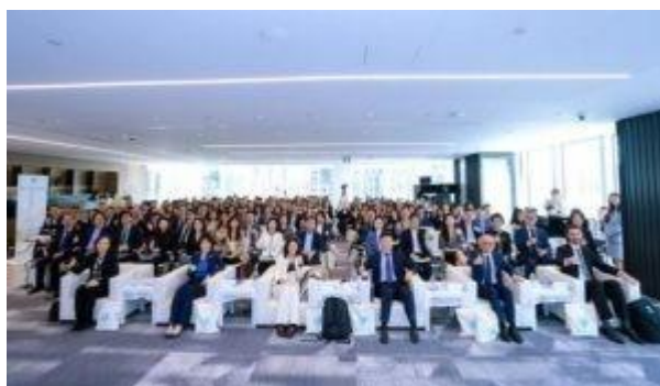
3-5 de noviembre de 2025, Rondas preliminares del UPICC Moot, Shanghái (China)

UPICC International Arbitration Moot (primera edición): Dedicado a explorar las aplicaciones e implicaciones de los UPICC en la práctica arbitral, el Moot representa un paso significativo para promover el instrumento dentro de la comunidad arbitral asiática en rápido crecimiento. Tras su lanzamiento oficial en 2024, las rondas preliminares de la edición inaugural concluyeron con éxito en Shanghái del 3 al 5 de noviembre de 2025. El evento atrajo a 26 equipos de 11 jurisdicciones, con árbitros procedentes de siete países distintos. Cuatro equipos avanzaron a las semifinales y finales, previstas en enero de 2026 en Roma.