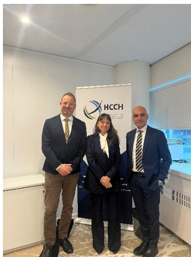
8 al 10 de octubre de 2025, HCCH Experts' Group on Carbon Markets, La Haya (Países Bajos)