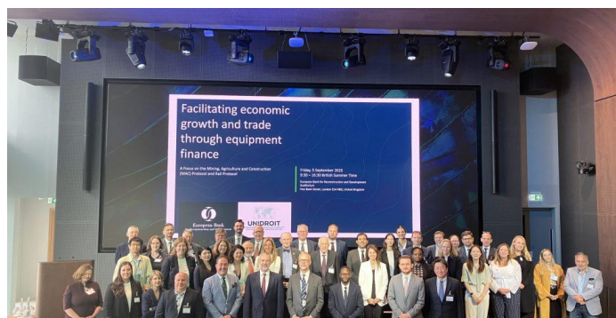
5 de septiembre de 2025, conferencia del BERD sobre el Protocolo MAC y el Protocolo Ferroviario, Londres (Reino Unido)

UNIDROIT continuó trabajando estrechamente con el BERD a lo largo de 2025 en la implementación de instrumentos de UNIDROIT destinados a facilitar el acceso al crédito en los tres continentes en los que opera el BERD. Además, el 5 de septiembre de 2025, UNIDROIT y el BERD organizaron conjuntamente una conferencia internacional titulada “Facilitating economic growth and trade through equipment finance - a focus on the Mining, Agriculture and Construction (MAC) Protocol and Rail Protocol”. La conferencia fue organizada por el BERD en su sede de Londres. Reunió a más de 90 representantes diplomáticos, funcionarios gubernamentales, representantes del sector privado y expertos jurídicos de 25 países para debatir cómo funcionan en la práctica el Protocolo MAC y el Protocolo Ferroviario, y cómo contribuyen a la expansión del crédito y al comercio internacional.