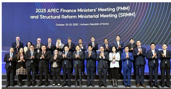
22 y 23 de octubre de 2025, Reunión de Ministros de Finanzas de APEC, Incheon (República de Corea)