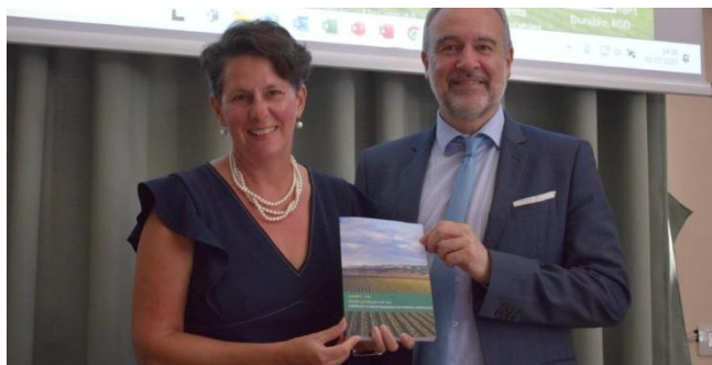
1 de julio de 2025, Lanzamiento de la versión francesa de la Guía ALIC, UNIDROIT, Roma (Italia)