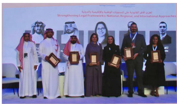
29 y 30 de octubre de 2025, Conferencia Internacional sobre la lucha contra el tráfico ilícito de bienes culturales, Riad (Arabia Saudita)