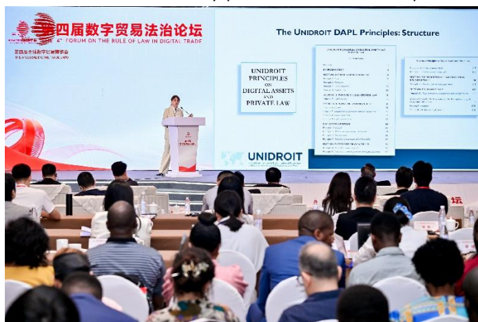
26 de septiembre de 2025, presentación sobre activos digitales, Hangzhou (China)