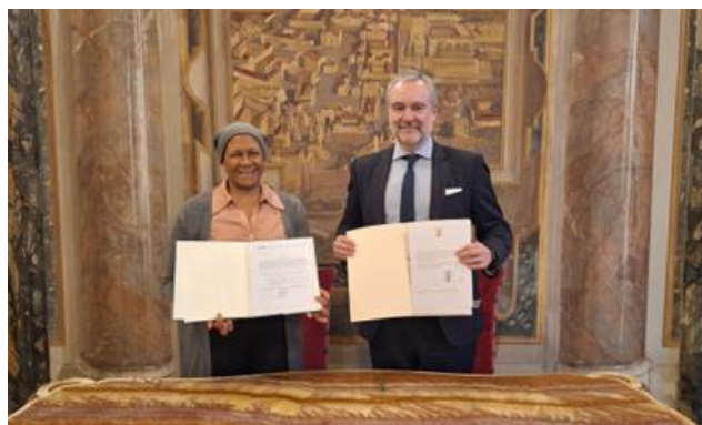
27 janvier 2025, dépôt de la ratification du Protocole ferroviaire de l'Afrique du Sud, UNIDROIT, Rome (Italie)