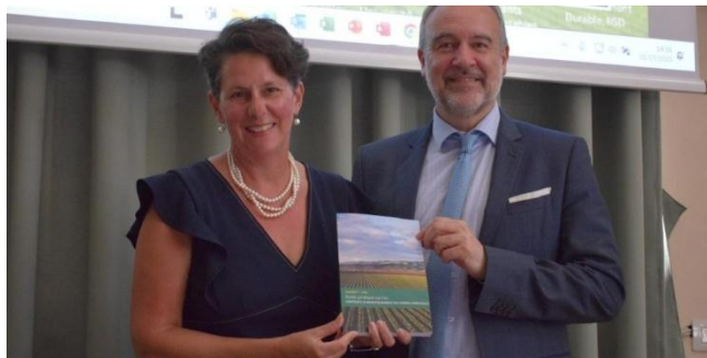
1 er juillet 2025, lancement de la version française du Guide CITA, UNIDROIT, Rome (Italie)