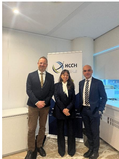
Du 8 au 10 octobre 2025, Groupe d'experts de la HCCH sur les marchés du carbone, La Haye (Pays-Bas)