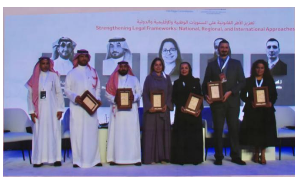
29-30 octobre, Conférence internationale sur la lutte contre le trafic illicite de biens culturels à Riyad, (Arabie Saoudite)