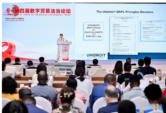
26 septembre, présentation sur les actifs numériques, Hangzhou (Chine)