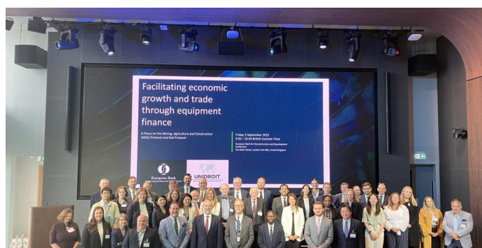
5 septembre 2025, Conférence de la BERD sur les Protocoles MAC et ferroviaires, Londres (Royaume-Uni)

Tout au long de l'année 2025, UNIDROIT a poursuivi son étroite collaboration avec la BERD en vue de la mise en œuvre des instruments d'UNIDROIT destinés à faciliter l'accès au crédit sur les trois continents où la BERD exerce ses activités. De plus, le 5 septembre 2025, UNIDROIT et la BERD ont conjointement organisé une conférence internationale intitulée " Facilitating economic growth and trade through equipment finance - a focus on the Mining, Agriculture and Construction (MAC) Protocol and Rail Protocol ". La conférence s'est tenue au siège de la BERD à Londres. Elle a réuni plus de 90 représentants diplomatiques, responsables gouvernementaux, représentants du secteur privé et experts juridiques de 25 pays afin de discuter du fonctionnement pratique des Protocoles MAC et ferroviaire et de leur contribution à l'expansion du crédit et au commerce international.