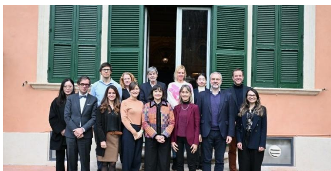
Du 19 au 21 novembre 2025, huitième session du Groupe de travail sur le SJCEA, UNIDROIT, Rome (Italie)

Du 19 au 21 novembre 2025, la huitième session du Groupe de travail s'est tenue en ligne et au siège d'UNIDROIT à Rome. Le Groupe de travail a examiné le texte de référence, en concentrant ses discussions sur le projet de préface et d'introduction, ainsi que sur les cinq chapitres traitant des structures juridiques et de l'analyse comparative.