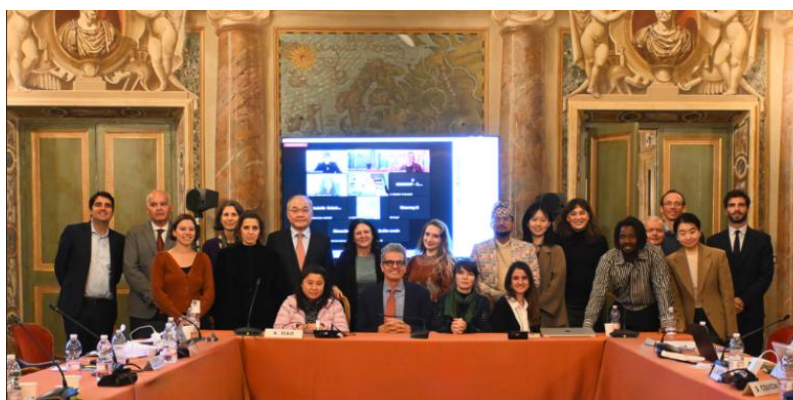
Quatrième session du Groupe de travail sur les biens orphelins, UNIDROIT, Rome (Italie)

La quatrième session du Groupe de travail s'est déroulée au siège d'UNIDROIT et en ligne du 1 er au 3 décembre 2025 et a débuté par un Colloque de recherche d'une journée sur le thème " Orphan Objects: Curatorial, Ethical, and Legal Aspects ". De nombreux experts (notamment des chercheurs en provenance, affiliés à des organisations nationales ou financées par l'État, à des organisations à but non lucratif ou à des groupes de recherche sur la provenance au sein d'institutions culturelles) ont été invités à aborder des sujets spécifiques en répondant à une série de questions prédéfinies. Au cours de la session, le Groupe de travail a poursuivi l'examen du projet de lignes directrices à la lumière des présentations faites lors du colloque de recherche et des documents préparés par le Secrétariat.