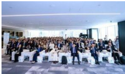
3-5 novembre 2025, épreuves préliminaires Concours international d'arbitrage sur les Principes d'UNIDROIT

Concours international d'arbitrage sur les Principes d'UNIDROIT (Première édition): dédié à l'étude des applications et des implications des Principes d'UNIDROIT dans la pratique arbitrale, ce concours marque une étape importante dans la promotion de cet instrument au sein de la communauté arbitrale asiatique en pleine expansion. Après son lancement officiel en 2024, les épreuves préliminaires de la première édition se sont déroulées avec succès à Shanghai du 3 au 5 novembre 2025. L'événement a attiré 26 équipes issues de onze juridictions, avec la participation d'arbitres provenant de sept pays différents. Quatre équipes se sont qualifiées pour les demi-finales et la finale, qui se dérouleront en janvier 2026 à Rome.