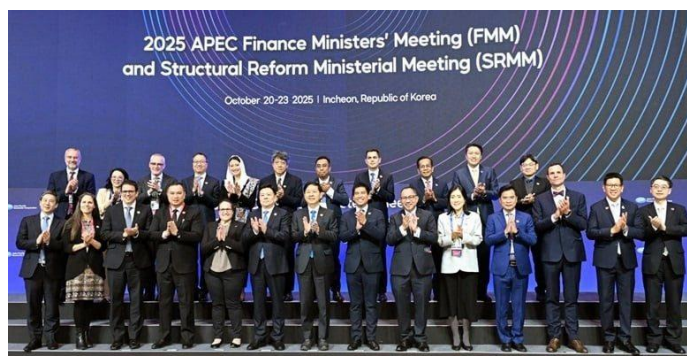
22-23 octobre, réunion des Ministres des Finances de l'APEC, Incheon (République de Corée)